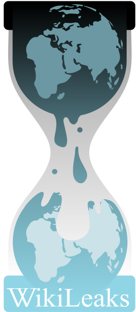
Wikileaks Logo, CC 3.0 Unported

Ich sage nicht, dass Assange und WikiLeaks perfekt sind. Manchmal haben sie Fehler gemacht, aber manchmal macht man Fehler, wenn man sich auf unbekanntem Terrain bewegt. Es ist immer eine Herausforderung, besonders wenn man Originaldokumente veröffentlichen will, eine Datenbank mit einer Million Dokumenten, ohne persönliche Informationen preiszugeben. Wenn man diese Dokumente nicht veröffentlicht, macht man natürlich keine Fehler. Zehn Jahre später greifen wir immer noch auf die Depeschen zu und sie sind immer noch relevant. Ich greife täglich auf die WikiLeaks-Depeschendatenbank zu. Ich suche nach einem einzelnen Politiker, Diplomaten oder einer NGO und sehe nach, ob es Informationen über sie gibt. Sie müssen Assange nicht anrufen und um Zugang zu der Datenbank bitten, Sie gehen einfach auf die Webseite und schauen nach.