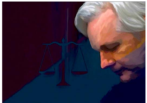
Anwälte für Assange